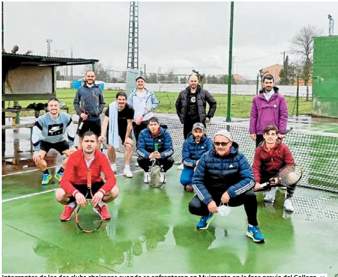
Integrantes de los dos clubs chairegos cuando se enfrentaron en Muimenta en la fase previa del Gallego.

Una lucha distinta es la que le toca afrontar al CT Vilalbés, que, tras quedar cuarto en el grupo A —ganó dos jornadas, empató una y perdió dos— tendrá que disputar